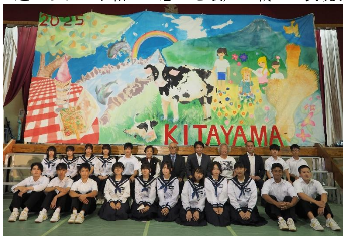
文化部制作の「キッズゲルニカ」

英語で思いを伝える姿、本の魅力を紹介する姿、学んだことを朗読する姿、楽器を使って素敵な音色を奏でる姿、仲間と共に合唱する姿、自分の特技を披露する姿がありました。また、今回は特別な取組として「キッズゲルニカお披露目会」を行いました。文化部制作の絵に込められた平和への想いを歌声に載せて表現する姿と出会うことができました。